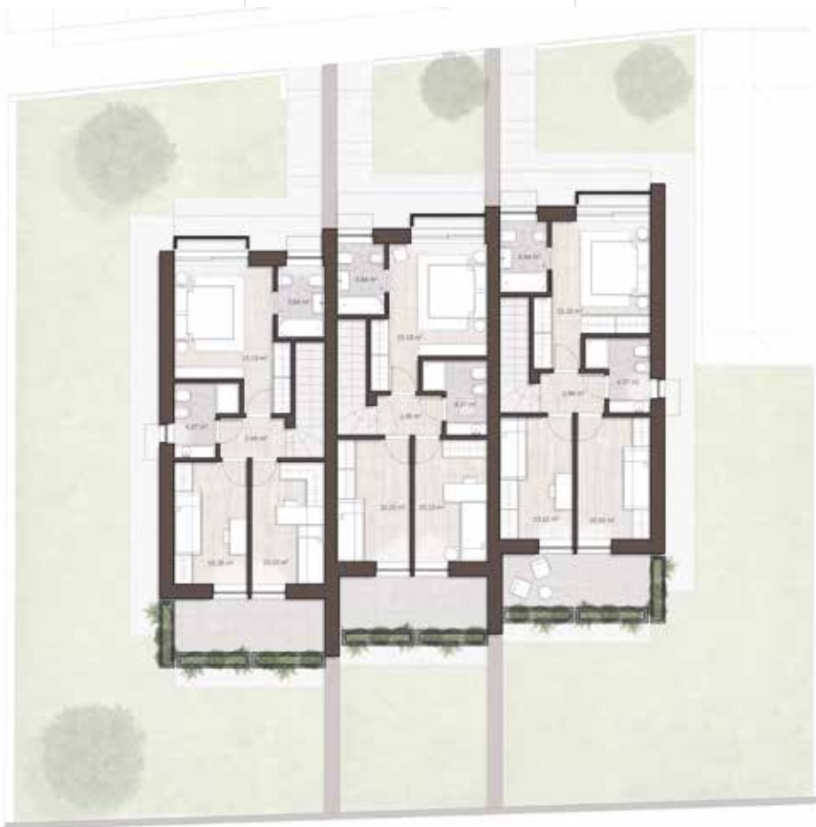
planimetria primo piano